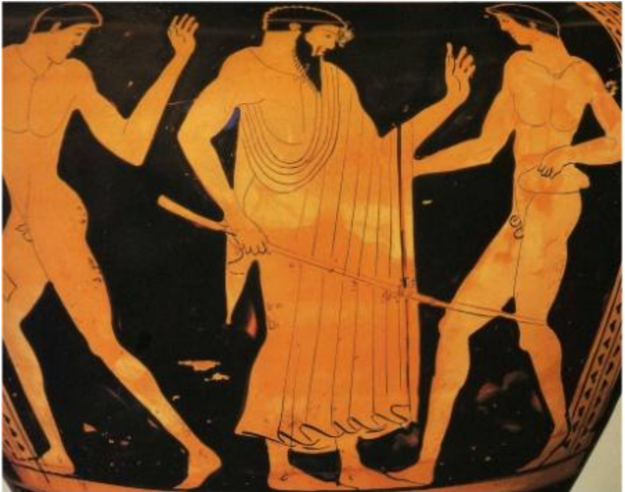
Corrección de la pierna de salto por un profesor