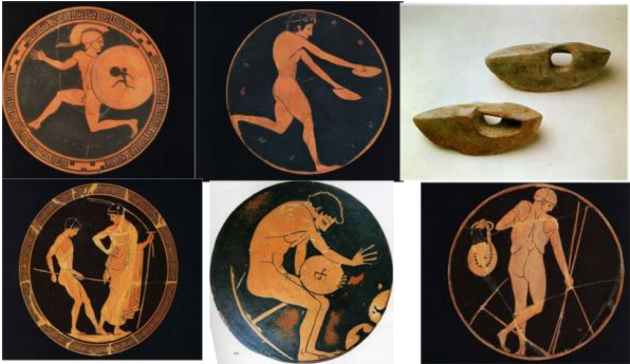
Hoplita, saltador de longitud, halteras para saltar, lanzador de disco y acontes.