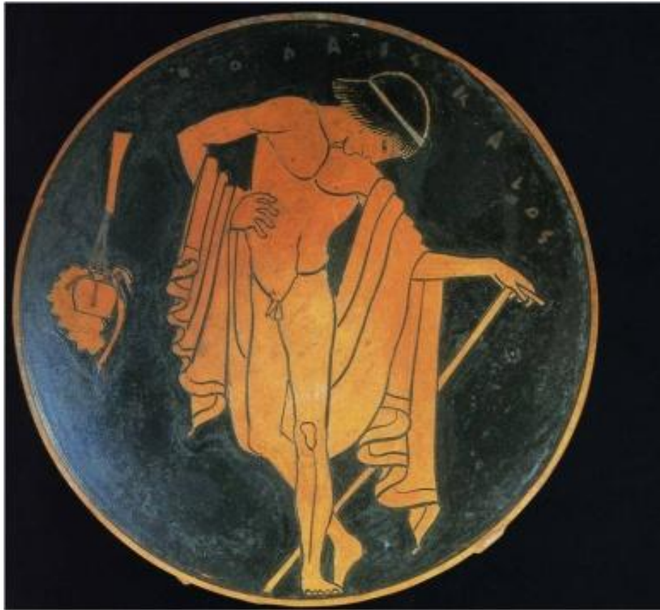
Efebo con bastón y bolsa de ungüentos

En el 395 d.C. los bárbaros invadieron y saquearon Olimpia y en el 408. Teodosio II y Honorio emperadores romanos de occidente y oriente, decretaron la destrucción de los templos y lugares dedicados a dioses paganos. Supuso la destrucción de los juegos y del ideal educativo en el que el cuerpo tenía protagonismo, para ser reducido por motivos de la religión y por la visión cristiana del cuerpo como origen de pecado. El dualismo filosófico, estableció un sistema de porcentajes, en los cuales, la reducción de la mitad cuerpo, engrandecía a la mitad alma.