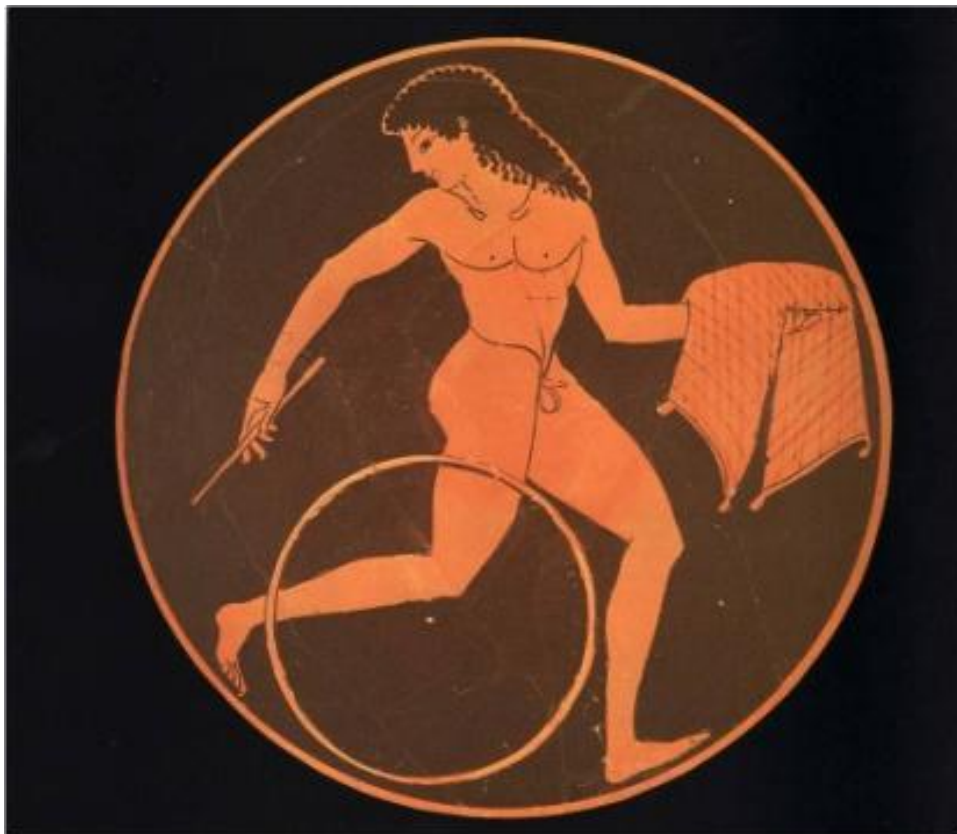
Efebo con aro, llevando la merienda

Los Juegos Olímpicos Antiguos: Ὀλυμπιακοὶ Ἀγῶνες; traducido como Olympiakoi Agones , no pueden ser considerados, en sentido estricto, como competiciones deportivas, ni siquiera como actividades atléticas; de hecho y dado su origen religioso y su función litúrgica, así como su fundamentación en el concepto griego y platónico del cuerpo como alma, tendrían más que ver con una exhibición de belleza y culto al cuerpo que con lo que actualmente entendemos como deporte, en cierto sentido como un desfile de modelos o mejor, un concurso de mises, misters o culturismo, en el sentido actual de este tipo de entrenamiento y actividades. En los juegos de la antigüedad, de acuerdo con la filosofía platónica, las ciudades participantes presentaban los cuerpos de sus ciudadanos entendidos como sombras del alma; de tal manera que, al presentarlos en el santuario de Olimpia en el