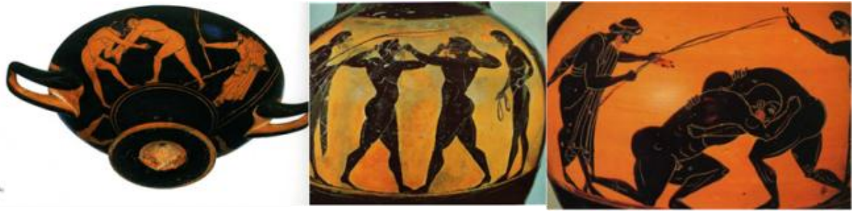
Lucha, pugilato y Pancraccio

La organización de los Juegos Olímpicos. Los primeros Juegos Olímpicos comenzaban con una fiesta en el santuario de Olimpia en honor a Zeus y a su harén de mujeres rubias, pertenecientes al templo, que se prostituían por un real.